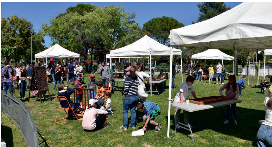
Les enfants ont pris plaisir à jouer entre amis ou en famille aux jeux en bois, tout en passant par le stand maquillage qui n'a pas désempli.