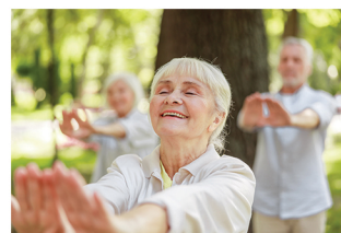
Salle du Baptistou

Cette discipline fondée sur le contrôle d'un mouvement, naturel, lent et détendu, associé à la maîtrise de la respiration et de la pensée. Elle aide à assouplir le corps, à gérer le stress et à se relaxer.