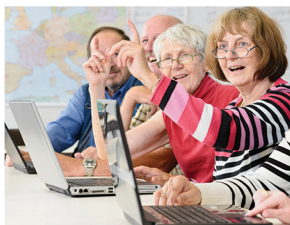
Atelier des projets

Proposé par l'association Ufcv, financé par la CFPPA, en partenariat avec la municipalité.