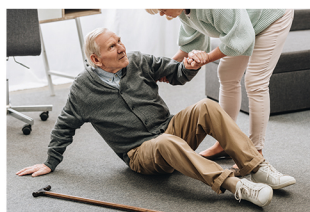
Halle des Verriès

Conférence de présentation : le mardi 19 septembre à 14h, Halle des Verriès