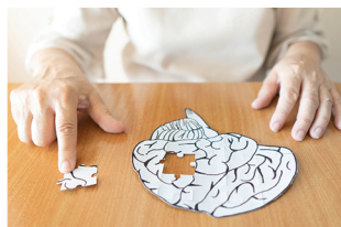
Salle de Fontgrande

Séances : débutants, le mardi de 9h30 à 10h30 mémoire avancée, le mardi de 10h30 à 11h30 à partir du 26/09/2023