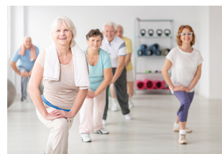
Salle de Fontgrande

La municipalité, en partenariat avec l'association Jouvence, propose deux fois par semaine, des séances d'activités physiques adaptées à la santé des seniors, encadrées par des professionnels spécialisés.