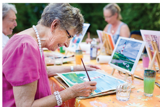
Salle de Fontgrande

Ces ateliers ont pour objectif de maintenir la dextérité manuelle à travers la création d'objets de décoration, de peinture, de scrapbooking, de couture, de compositions florales, de bijoux et d'activités à thème selon le calendrier.