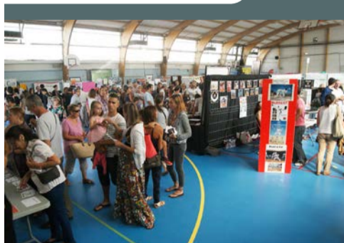
Journée des associations organisée par la municipalité, le 5 septembre