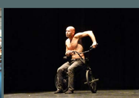
Spectacles de la Compagnie Yann Lheureux organisés par la municipalité, le 12 septembre