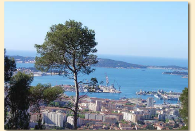
Rade de Toulon depuis le Mont Faron

Participation de 30 € par personne (le restant étant pris en charge par la municipalité). Se munir d'une pièce d'identité. Règlement par chèque libellé à l'ordre de la Trésorerie des Matelles.