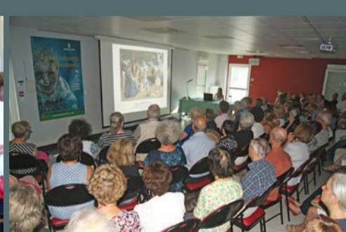
Conférence "Frédéric Bazille, la jeunesse de l'impressionnisme", organisée par la municipalité, le 30 juin