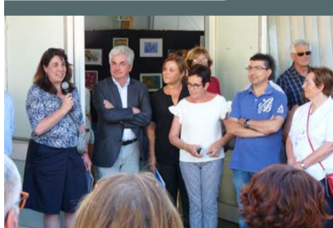
Monextpo, organisé par l'association artistique Monet, les 25 et 26 juin