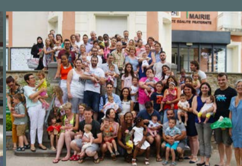
Réception des bébés saint-gillois, organisée par la municipalité, le 2 juillet