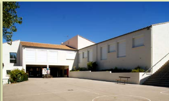
▲ Ravalement des façades des écoles Grand'Rue et Patius. Coût : 76 621,56 €