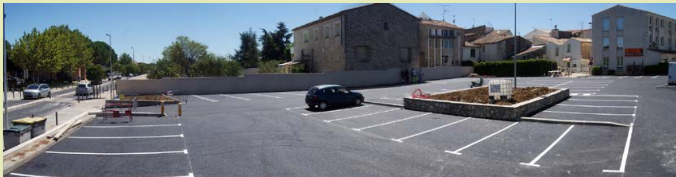
▼ Réfection du parking du Forum. Coût : 90 000 €