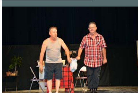
Représentations théâtrales de la Cie Entracte du 16 au 18 septembre