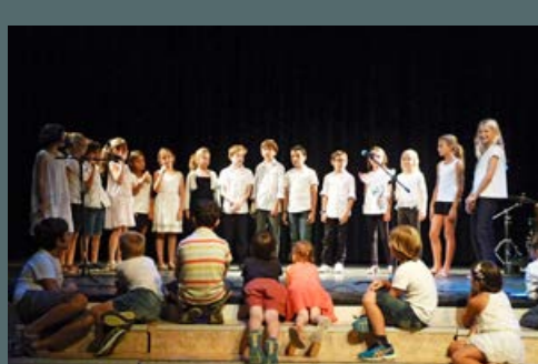
Concert des Petits Joueurs du 25 septembre