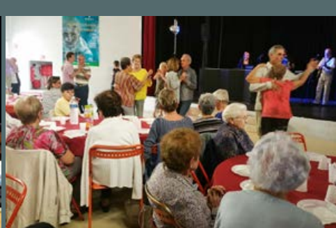
Semaine bleue - Après-midi musicale du 1 er octobre