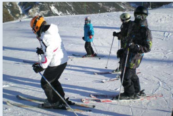
Inscriptions ouvertes à l'espace jeunesse / 04 67 58 15 62

Au programme : ski alpin, luge, veillées...