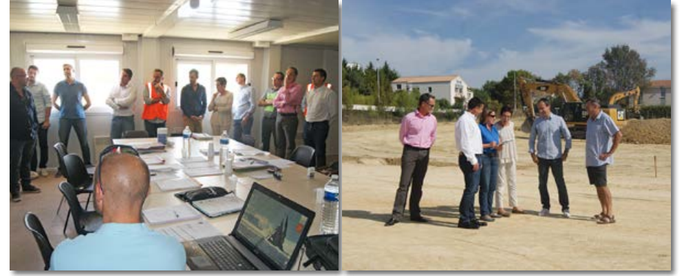
Réunion de chantier du 23 septembre dernier

Les terrassements, les plateformes et les parkings commencent ainsi à prendre forme. La date de fin de chantier théorique est prévue en mai 2017, pour une ouverture attendue à l'orée de l'été.