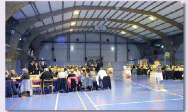
Après le repas, le groupe Sealsia a emmené les convives faire un p'tit tour dans les années sixties : un voyage dans la "Woodstock génération" !