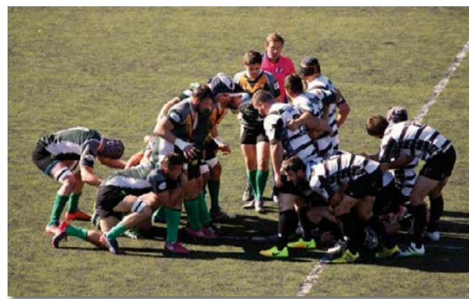
Premier match à domicile contre Villeneuve-Lès-Maguelone, conclu sur une victoire de 47 à 9.

Les entraînements et matchs ont pour l'instant lieu au pôle sportif de la CCGPSL établi sur la commune des Matelles. Dès que possible, les rugbymen évolueront sur un nouveau site : les anciens équipements de l'École de Rugby du Pic Saint-Loup avenue Saint Sauveur, à Saint-Clément-de-Rivière, actuellement en cours de réfection.