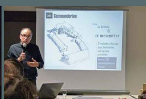
Pause-culture, organisée avec le concours de la municipalité, le 7 octobre