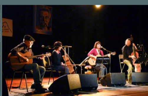
«Saint-Gély a rendez-vous avec Brassens et Jean Ferrat» organisé par «J'ai rendez-vous avec vous», en partenariat avec la municipalité, la CCGPSL et le département, du 10 au 12 novembre