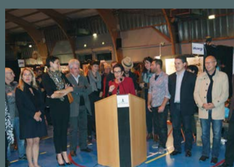
Forum des arts organisé par l'association artistique Monet, les 5 et 6 novembre