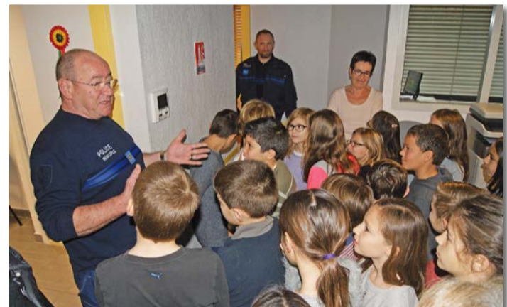
Arrêt dans les bureaux de la Police municipale