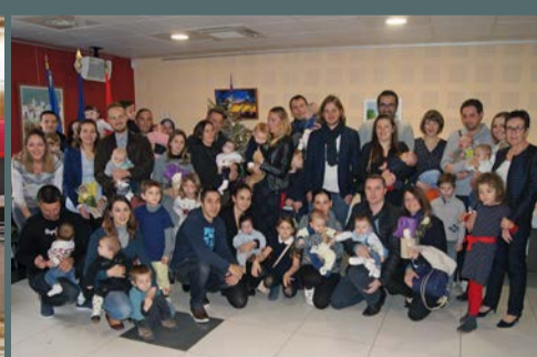
Réception des bébés saint-gillois organisée par la municipalité, le 10 décembre 2016