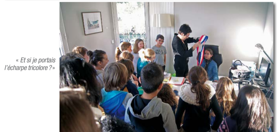
« Et si je portais l'écharpe tricolore ? »