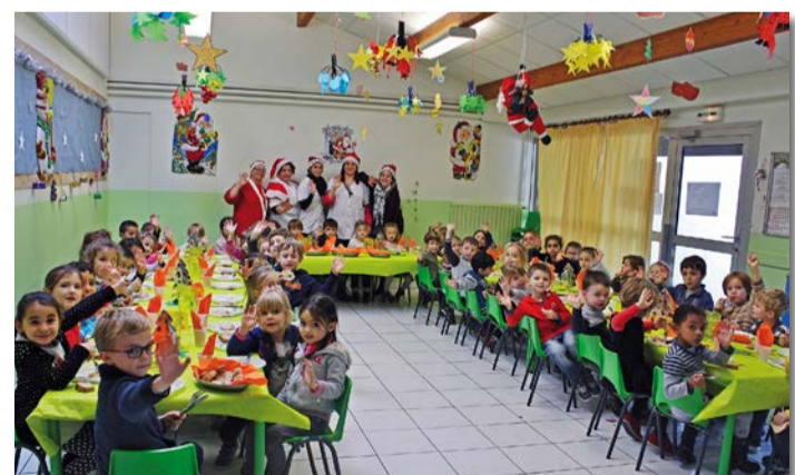
Repas de Noël à l'école maternelle Patus