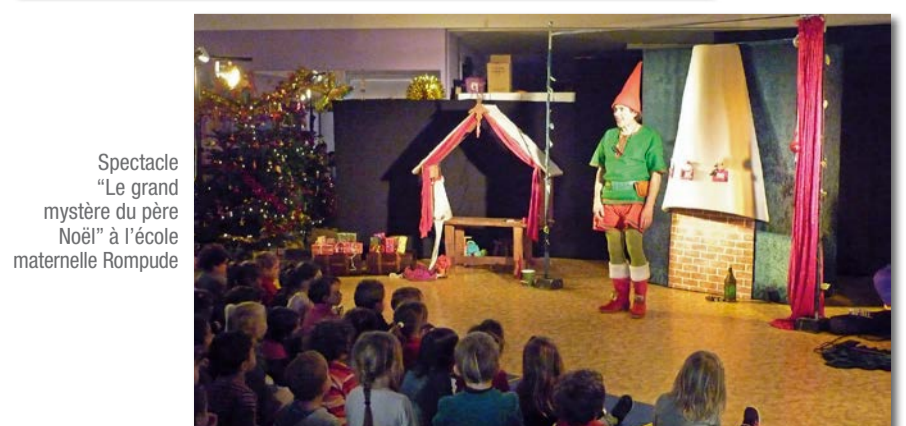
Spectacle "Le grand mystère du père Noël" à l'école maternelle Rompude