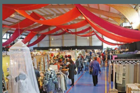
Salon de l'Artisanat d'Art organisé par la municipalité, les 26 et 27 novembre 2016