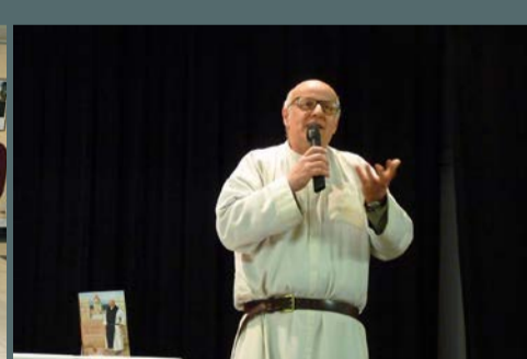
Pause-culture "Le lieu de travail, enfer ou paradis?" organisée avec le concours de la municipalité, le 23 février