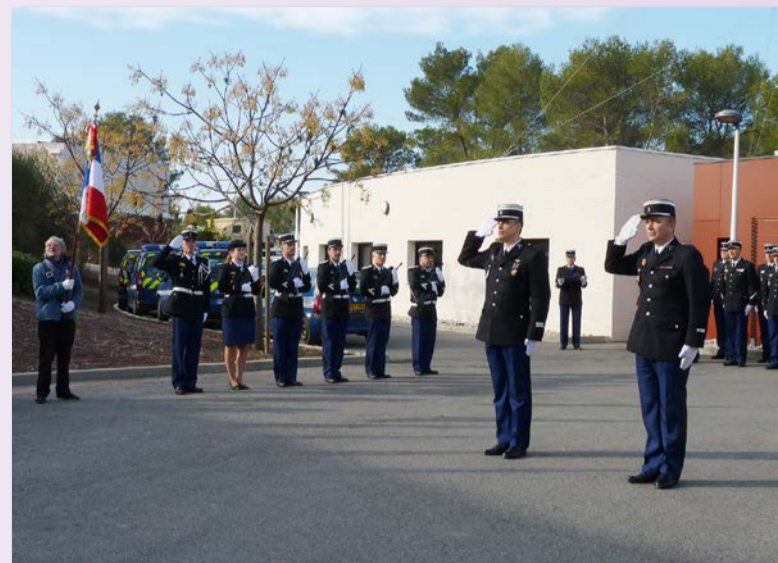
La brigade couvre sept communes (Saint-Gély-du-Fesc, Saint-Clément-de-Rivière, Grabels, Les Matelles, Vailhauquès, Combaillaux et Murles)