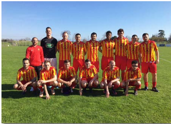
Le 24 février, les joueurs des équipes U19 (- de 19 ans) et seniors ont reçu le prix du fair-play. Il vient récompenser un état d'esprit jugé irréprochable lors de la saison 2015-2016.

Cette équipe est également toujours en lice en coupe de l'Hérault, où elle est désormais en 1/4 de finale de la compétition. Le 19 février dernier, elle a battu l'équipe de Saint-Jean-de-Védas sur le score de 2 buts à 1, après prolongations.