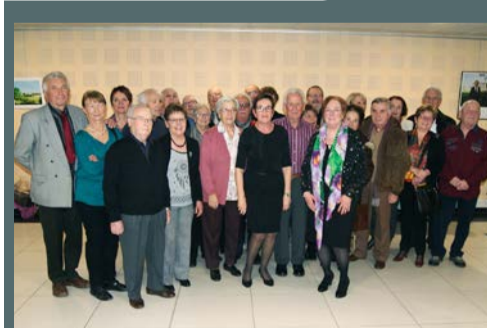
Noces d'or et de diamant organisées par la municipalité, le 3 février