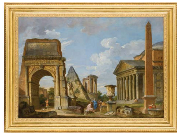
Ruines antiques de Pannini Giovanni Paolo

« De la Renaissance jusqu'à nos jours, la ruine est un motif prégnant dans l'imaginaire poétique et artistique européen. Éveillant le souvenir des glorieux empires défunts, elle suscite fascination, émulation et espoir d'une renaissance, mais elle peut également plonger le spectateur dans une rêverie mélancolique sur le temps qui passe. À de multiples reprises, les artistes comme les écrivains se sont fait les interprètes de ces différents sentiments. Le fonds de peinture et de dessin du musée Fabre est particulièrement marqué par ce motif esthétique ».