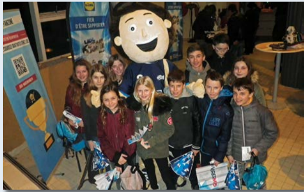
Sortie match MAHB/Créteil, au gymnase René Bougnol de Montpellier, le 15 février