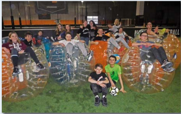
Sortie bubble foot, à l'Urban soccer de Castelnaud-le-Lez, le 14 février