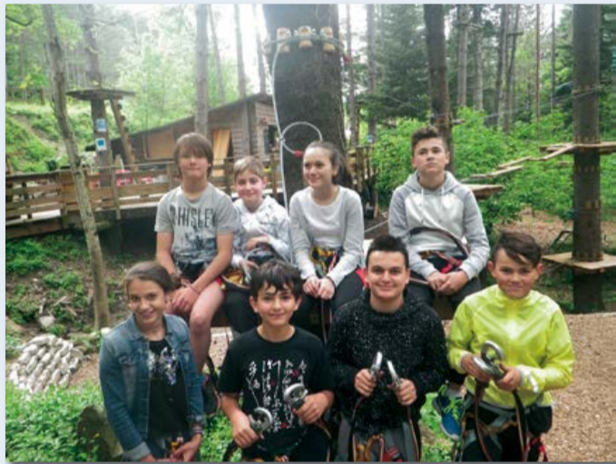
Sortie accrobranche, à Montdardier