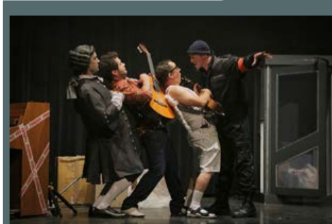
Spectacle musical Djobi Djobach par la compagnie Swing Hommes organisé par l'ASSG Football, le 28 mai