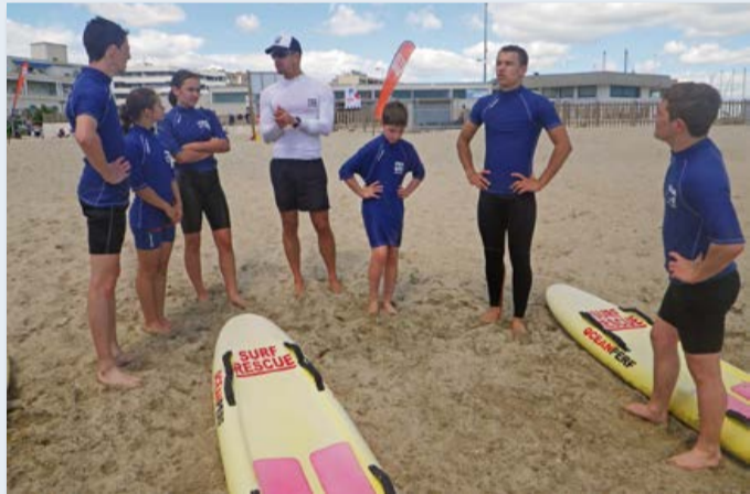
Sortie sauvetage aquatique, à Palavas-les-Flots