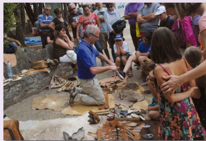
Démonstration de taille de silex et d'allumage du feu