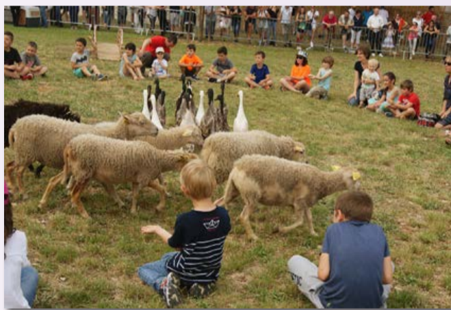
Démonstration de chiens de troupeaux