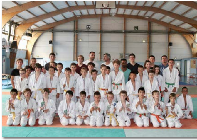
Finales des interclubs du samedi 20 mai