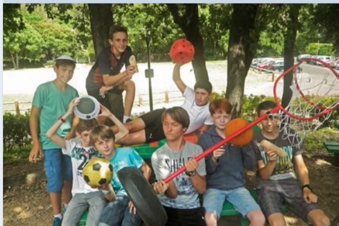
Animation "Journée mondiale du jeu"