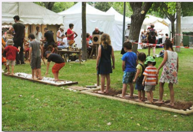
Sentier sensoriel pieds nus

Beaucoup d'enfants ont profité des différents espaces dédiés à la nature et à l'environnement. « Ils ont été à la fois émerveillés et impressionnés, de voir d'aussi près, des animaux qu'ils n'ont pas l'occasion d'approcher très souvent », nous confie une jeune maman, venue de Toulouse avec ses deux enfants. La présence d'ateliers ludiques leur a également permis d'emmagasiner de précieuses connaissances sur la faune et la flore. Le bassin d'initiation à la pêche a été particulièrement fréquenté. Pendant ces instants privilégiés, les parents ont pu tranquillement observer leurs petits, ravis de les regarder s'épanouir, au cœur d'un événement plus vrai que nature. Pour clôturer cette 30 e édition, qui restera gravée dans les mémoires, un spectacle équestre d'une qualité exceptionnelle a capté l'attention d'un public enthousiaste, venu des quatre coins de France et même parfois au-delà.