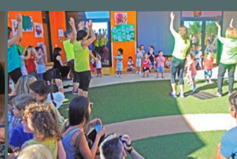
Fête du multi-accueil les Lutins, le 8 juin