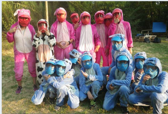
Paintball, à Gignac

À venir : Vendredi 7 juillet : soirée bal de fin d'année, à l'Espace jeunesse