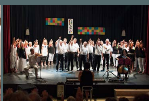
Concert de la chorale Mosaïque Chœur du Pic, le 24 juin