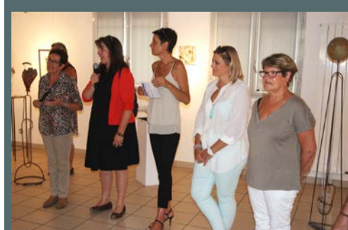
"Monetexpo" - expositions des professeurs de l'Association Artistique Monet, du 20 au 27 juin