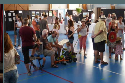
"Monetexpo" - exposition des adhérents de l'Association Artistique Monet, les 24 et 25 juin