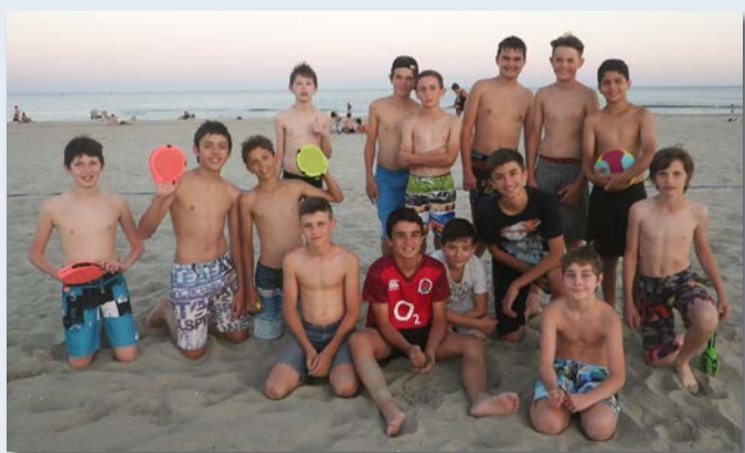
Plage, à Pérols et Palavas-les-Flots