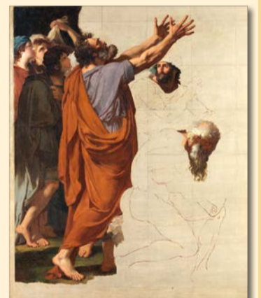
François-Xavier Fabre (Montpellier, 1766 - Montpellier, 1837) La Prédication de saint Jean Baptiste, fragment inachevé. Huile sur toile

L'exposition conduira le visiteur jusqu'au Montpellier du temps de la Révolution, lorsqu'un premier musée fut créé, un quart de siècle avant la refondation du musée par Fabre.