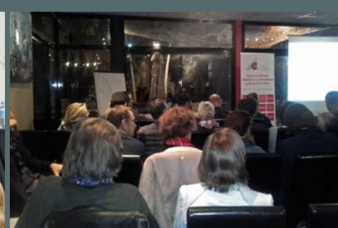
Intervention proposée par les ACE du Pic "Facebook : mode d'emploi pour créer votre page entreprise", le 25 octobre