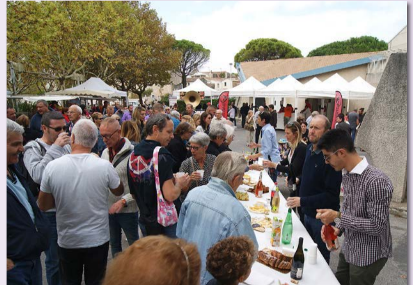
Le verre de l'amitié a été partagé dans une ambiance musicale

La journée était véritablement festive, rythmée par la peña Les Aux-Temps-Tics qui a su transmettre son énergie communicative.