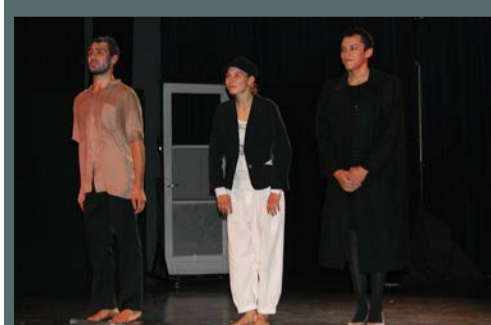
Saison culturelle la Devoiselle, Compagnie Corps itinérants « Le temps des autres », le 6 octobre