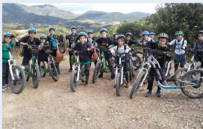
Multi-activités - trottinette électrique