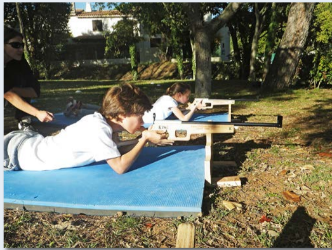
Multi-activités - initiation au tir du biathlon