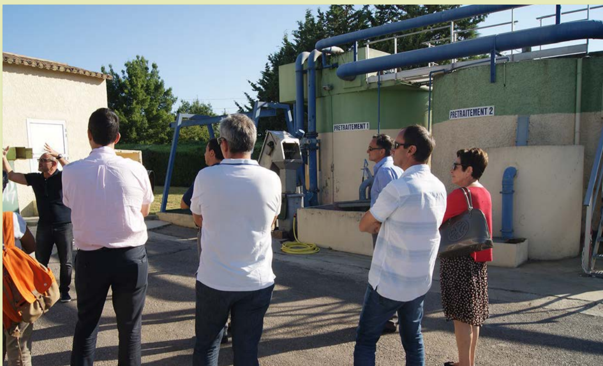
Visite de la station d'épuration par le Conseil municipal.

Pourtant, ces mesures ne suffisent pas à juguler immédiatement et complètement cette immixtion ponctuelle d'eau pluviale dans le réseau d'assainissement des eaux usées. Un dispositif plus