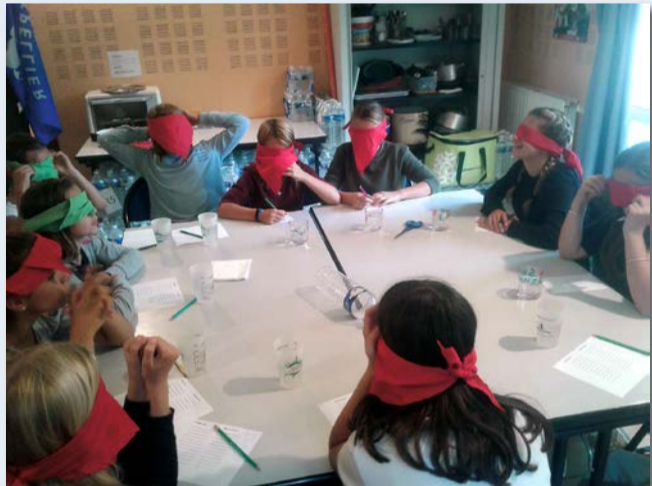
Animation sur le thème du goût à l'Espace jeunesse dans le cadre de la Semaine nationale du goût, du 9 au 14 octobre