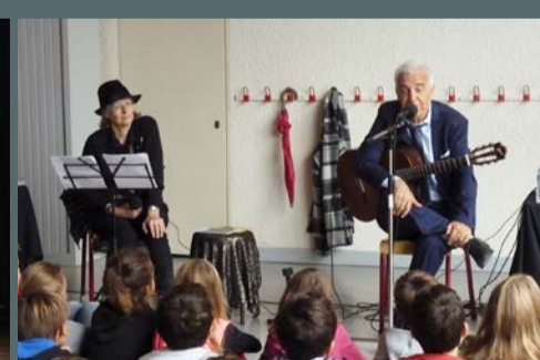
"Si Brassens m'était conté" organisé par "J'ai rendez-vous avec vous", le 19 octobre