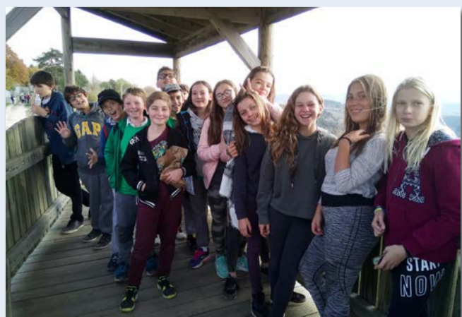
Mini-camp à la Canourgue, en Lozère