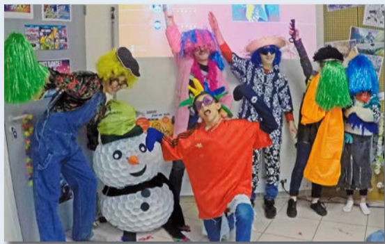
Carnaval et goûter, à l'Espace jeunesse