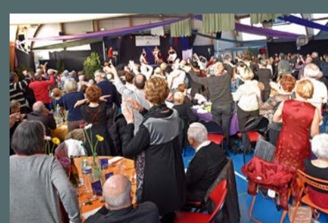
Repas des aînés organisé par la municipalité, le 27 janvier