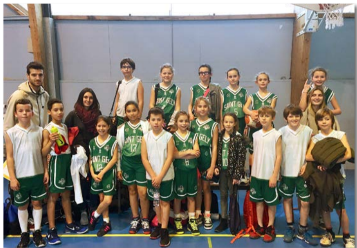
Le club continue de travailler sur son image 2.0, en renforçant sa visibilité sur les réseaux sociaux, comme en témoignent les 1 250 personnes suivant le club, via Facebook.