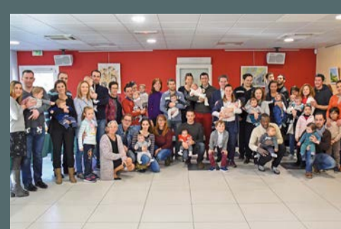
Réception des bébés st-gillois organisée par la municipalité, le 10 février