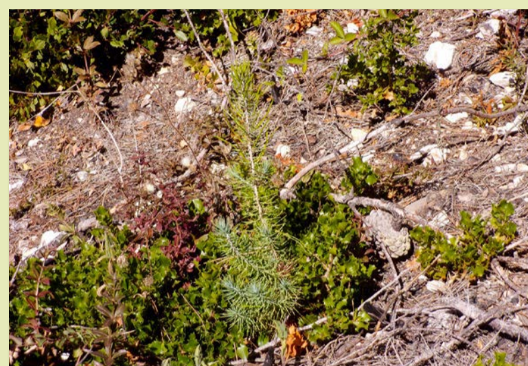
Un semis de pins d'Alep 5 ans après l'incendie