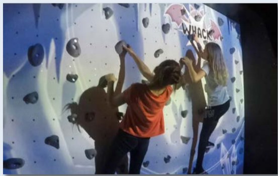
Sortie Mad Monkey "Climb&Play"