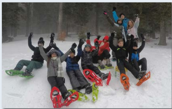
Jeux de neige, luge et initiation biathlon au Mont Aigoual