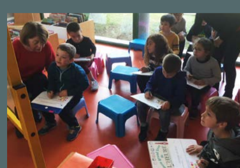
Animation "Alphabet arc-en-ciel", proposée par la bibliothèque aux élèves de CP Grand'Rue, le 22 mars