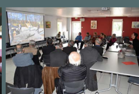
Premier atelier "Raconte-moi Saint-Gély-du-Fesc", proposé par l'association Feel'U, en partenariat avec la municipalité