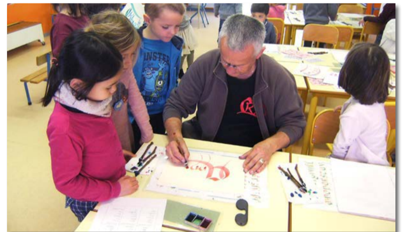
Maternelle Rompu de

En préambule de l’évènement “Les Médiévales du Grand Pic Saint-Loup”, qui se déroule cette année sur notre commune le 6 mai, la Communauté de communes a organisé auprès des scolaires (grandes sections de maternelles et élémentaires) des ateliers calligraphie, durant le mois de mars.