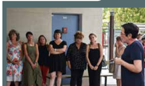
Apéritif de fin d'année à l'école élémentaire Grand'Rue, le 7 juillet