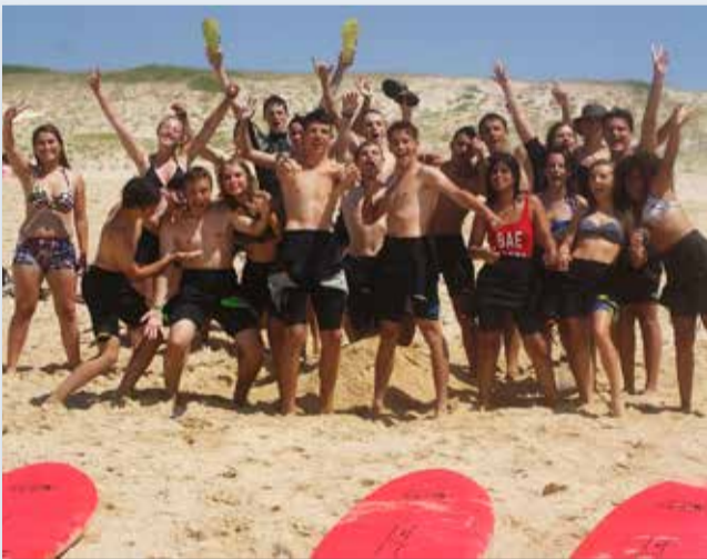
Surf pour les 14-17 ans dans les Landes, du 30 juillet au 3 août