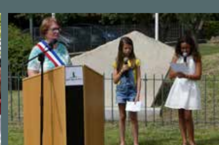
Fête nationale organisée par la municipalité, le 14 juillet