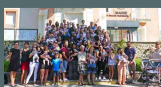
Réception des bébés saint-gillois organisée par la municipalité, le 1 er septembre