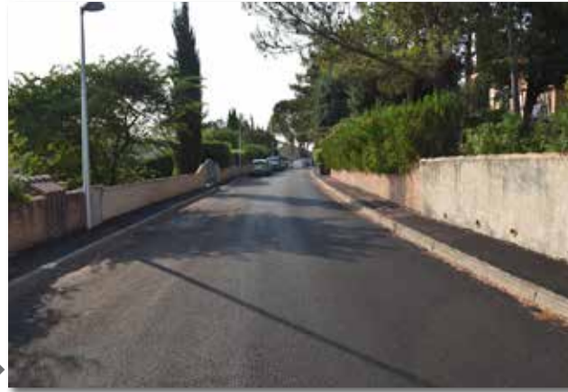
Rue des Oliviers ▶

D'autres travaux de voiries sont à prévoir d'ici la fin de l'année, en commençant par la rue des Vignes blanches au mois de septembre.