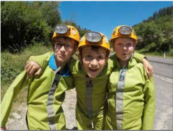
Spéléologie pour les 12-14 ans à La Canourgue, du 9 au 13 juillet

Grâce à l'Espace jeunesse, nos jeunes ont pu profiter de nombreuses activités : camps, semaines multi-activités, animations à la carte.