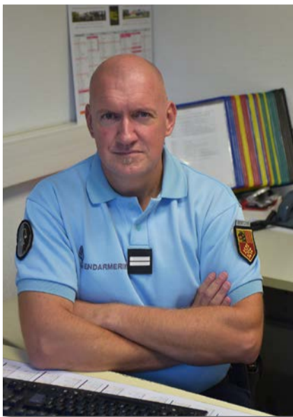
43 ans, marié - 2 enfants Passionné de marathon, inscrit au Saint-Gély athlétisme

Nous sommes 24 gendarmes, dont 22 militaires de carrière et deux gendarmes adjoints. Depuis notre installation dans nos locaux actuels en 2012, trois gendarmes supplémentaires nous ont rejoints.