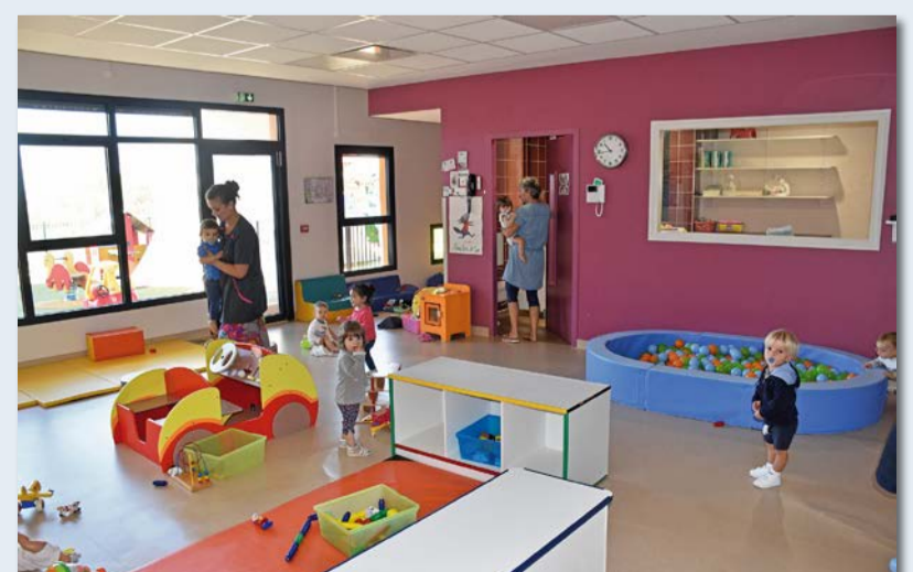
Les enfants profitent toujours des autres modules installés précédemment.