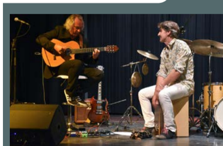
Saison culturelle la Devoiselle, "Dreams" concert proposé par la municipalité, le 5 octobre