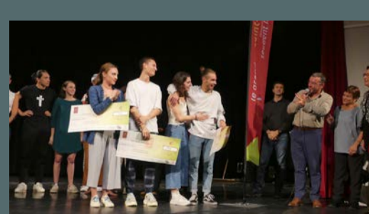
2 e Concours chorégraphique "A pas de loup" organisé par la Communauté de communes du Grand Pic St-Loup, le 19 octobre