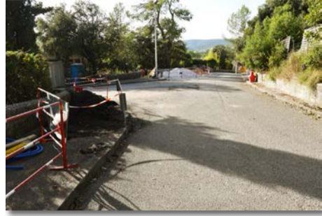
Rue du Bosc ▲ Avenue du Pic Saint-Loup