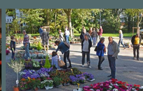
St-Gély fête l'automne - marché des plantations et des produits du terroir organisé par la municipalité, le 21 octobre