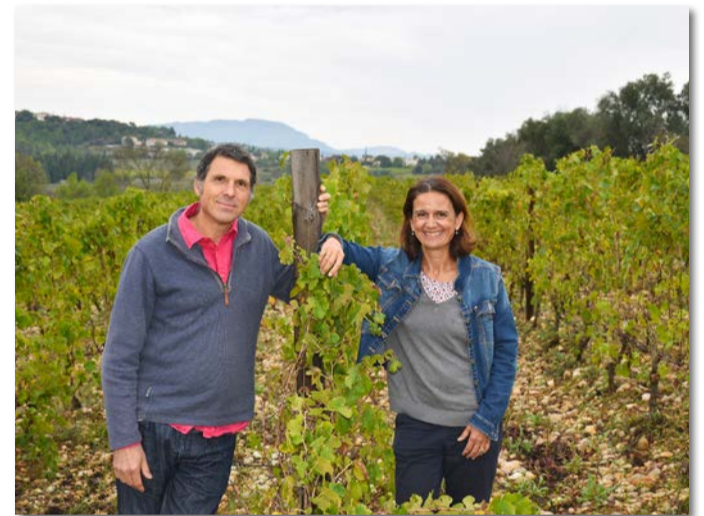
Le Chemin des rêves est situé sur une colline, posé sur des sols calcaires et argileux, où roulent de gros galets et s'accrochent des vignes plantées il y a 50 ans.

C'est en se promenant dans les allées, qu'on ressent les premiers bienfaits de cette dynamique écologique. L'odeur et la couleur du sol changent ; On observe une grande diversité d'insectes de plantes, « les taux importants de matière organique favorisant aussi les réserves d'eau du sol ». Bien-entendu, pour le travail du vigneron, c'est gratifiant. « On acquiert en autonomie et on apprend tous les jours, notamment dans le domaine de l'agronomie ».