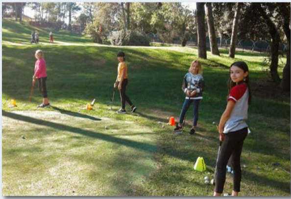
Semaine sportive multi-activités

L'Espace jeunesse a été ouvert pendant toutes les vacances. Des activités diverses et variées ont été proposées aux jeunes présents.