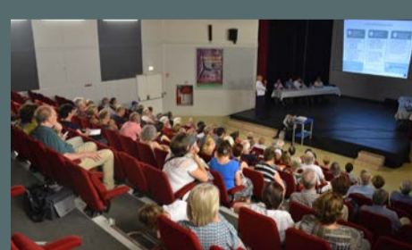
Mutuelle communale, réunion d'information, organisée par la municipalité, le 26 juin