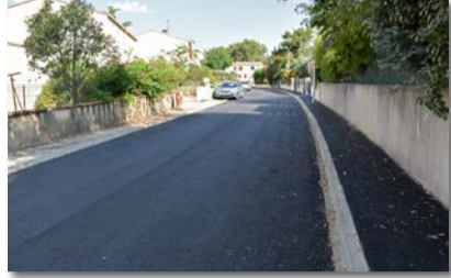
Rue des Grenaches