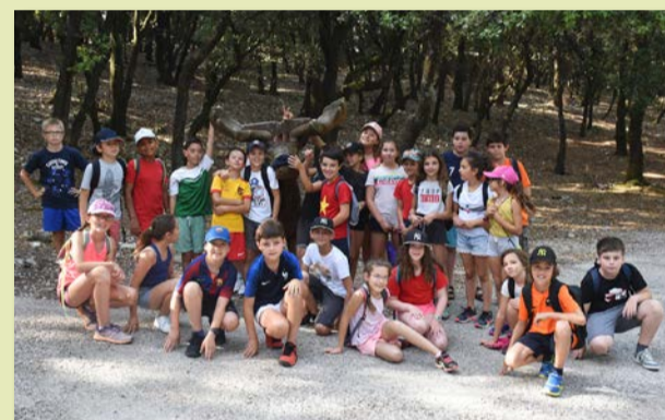
Atelier multi-activités à dominante sportive