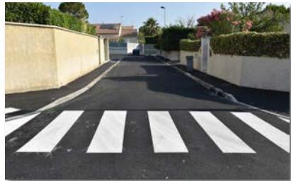
Allée de la Marquise

Suite à la réunion de concertation avec les riverains qui s'est déroulée le 3 juin dernier, la réhabilitation devrait commencer au mois de septembre.