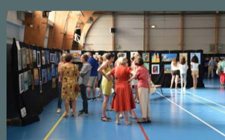
Moneypxo, exposition des adhérents, organisée par AAM, dimanche 23 juin