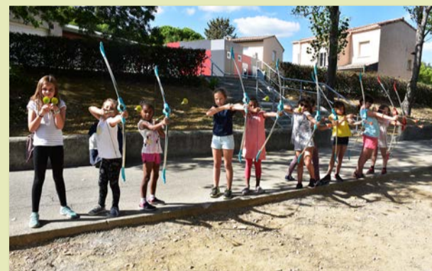
ALSH les Galopins