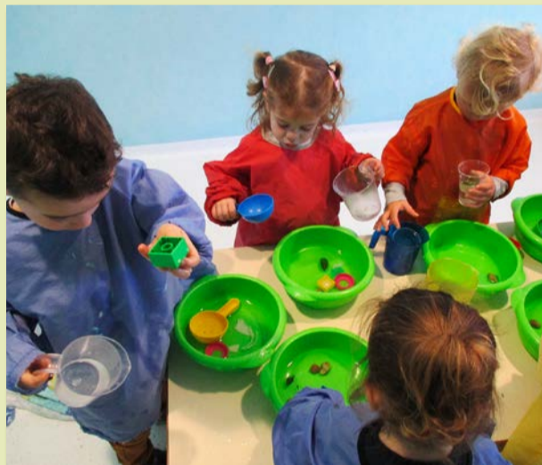
Multi-accueil les Lutins