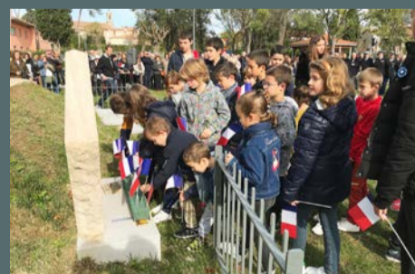
Commémoration du 11 novembre organisée par la municipalité