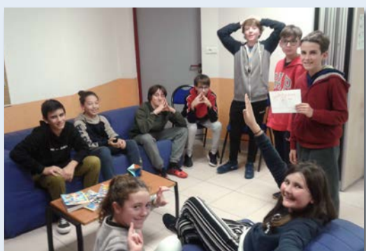
Par équipes, ils ont été amenés à produire une scène tirée au sort sur un des droits de l'enfant, pour ensuite la faire deviner aux équipes respectives. Entre deux scénettes, ils ont également eu droit à un quizz sur cette thématique.

Dans le cadre des 30 ans de la Journée internationale des droits de l'enfant, les ados ont eu droit à plusieurs activités.