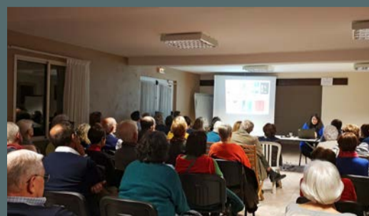
Pause-culture « Less is more - Le Bauhaus et Pierre Soulages : deux centenaires - une devise » organisée avec le concours de la municipalité, le 15 novembre