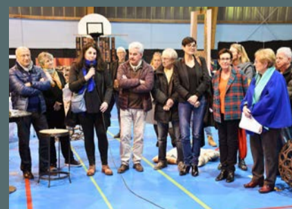
Forum des Arts organisé par l'Association Artistique Monet, les 16 et 17 novembre