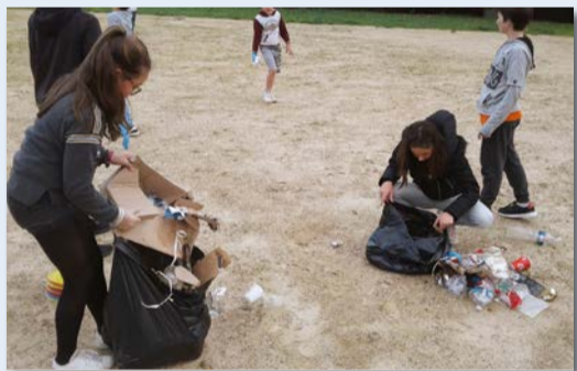
À partir de plusieurs ateliers, ils ont ramassé un maximum de déchets, tout en cherchant à repérer les différentes catégories.

Du 19 au 23 novembre, les jeunes ont été sensibilisés de manière ludique à la nécessité de réduire nos déchets.