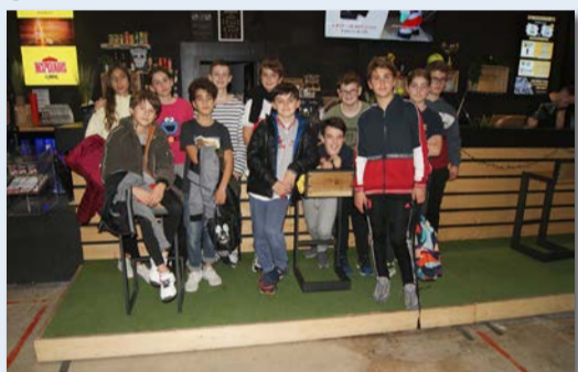
Sortie Sport break