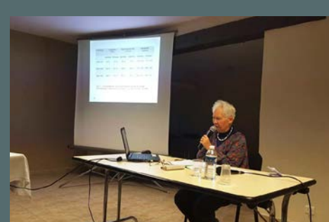
Pause-culture "La scolarisation des filles à St-Gély autrefois" par D. Bertrand-Fabre organisée avec le concours de la municipalité, le 10 janvier 2020