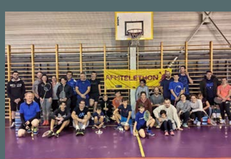
Nuit du bad organisée par le SGSC badminton, le 7 décembre 2019