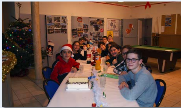
Goûter de Noël