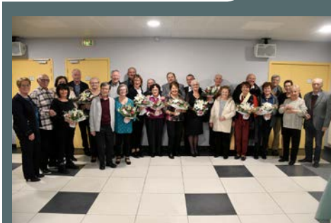
Noces d'or et de diamant organisées par la municipalité, le 6 décembre 2019