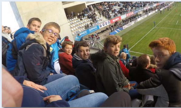
Sortie rugby MHR/Toulouse