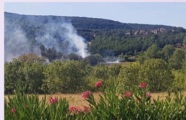
Le 4 août dernier, les services d'incendie et de secours ont rapidement circonscrit un départ de feu dû à l'utilisation d'une machine agricole à la sortie de notre commune, route de Combaillaux. Le CCFF était présent et a fait preuve de solidarité. La gendarmerie s'est rendue rapidement sur place pour procéder aux premières constatations.