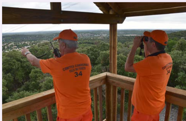
Cette année, les bénévoles du CCFF ont pu utiliser une tour de guet installée par la municipalité au Bois d'Escary, leur permettant ainsi d'optimiser la surveillance de nos massifs grâce à une vision panoramique.

fumée suspecte sur l'ensemble de nos espaces naturels ; Chaque tournée représentant environ une quarantaine de kilomètres. « Lors de la première semaine du mois d'août, les conditions climatiques nous ont poussés à effectuer des patrouilles quasiment tous les jours car nous étions en situation d'alerte maximale », nous expliquent-ils.