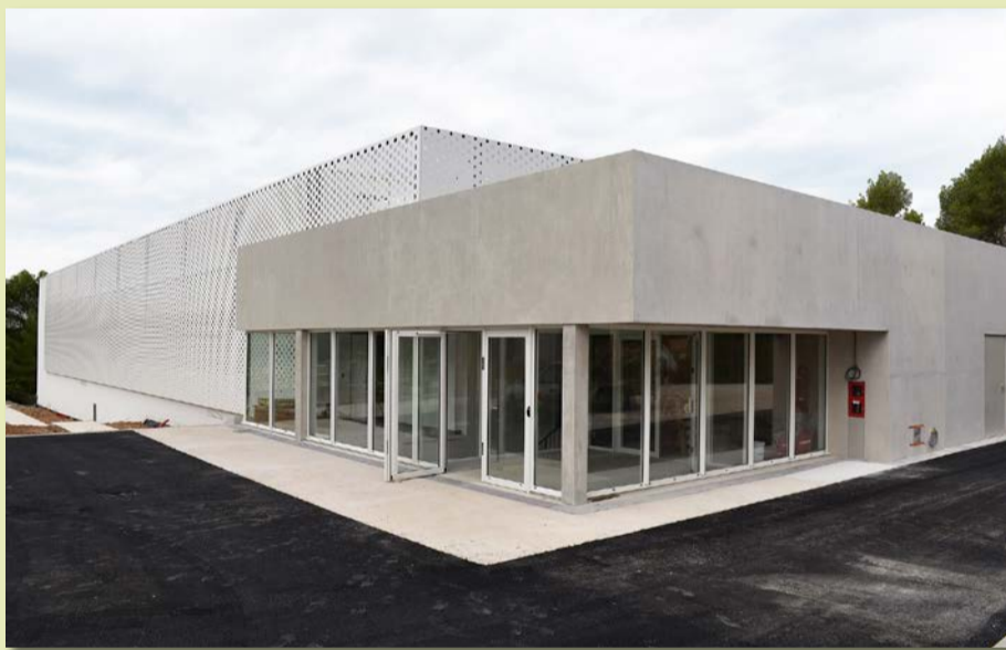
Halle des sports des Verriès