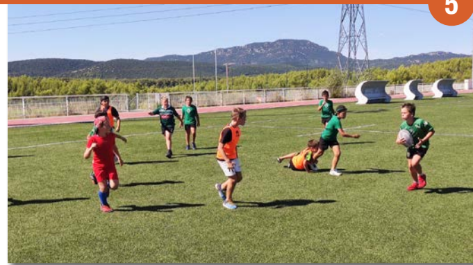
L'école de rugby du Grand Pic Saint-Loup (ERPSL) compte actuellement 250 jeunes licenciés de 5 ans à 18 ans. Ils sont encadrés par une équipe de 80 bénévoles, dont 32 éducateurs.

En complément des sections d'âges habituelles, il existe différents niveaux en compétition : débutant, débrouillé, confirmé. Cette distinction offre à chacun la possibilité de pratiquer le rugby à son rythme et en totale sécurité. « Sur le plan technique, on apprend à l'entraînement à adopter les bonnes postures : savoir tomber et se protéger, privilégier le jeu de passes... »