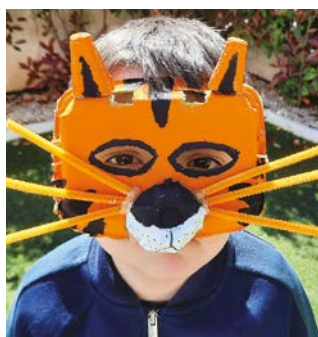
Lisandro B - 6 ans