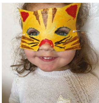
Romy D - 3 ans