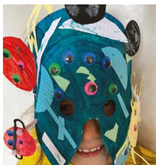
Louise D - 7 ans