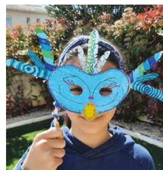
Toscane B - 10 ans