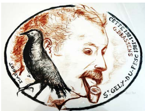
Tableau réalisé au fusain par Eric Battista, peintre Sétois, ami de Brassens

Pour cette année particulière, les festivités débiteront dès le 21 juin à l'occasion de la fête de la musique, se poursuivront le 9 juillet, avant de finir en apothéose du 11 au 14 novembre.