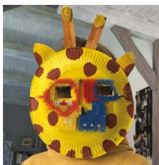
Milan B - 5 ans