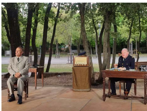
Représentation théâtrale « Meilleurs alliés », le 18 juin