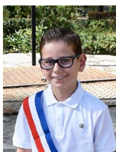
Oscar GARCIN MENU