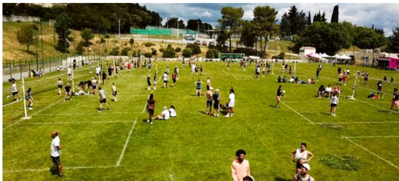
Le 14 mai, le club a organisé son tournoi annuel de volley sur herbe. 65 équipes mixtes et 5 équipes jeunes de 3 joueurs ont été accueillies au stade Jérôme Zammit.

Précisons enfin que des interventions ont lieu trois fois par semaine dans les écoles Valène et Patus pendant le temps périscolaire.