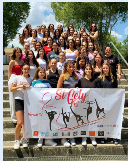
Le club a reçu le trophée «Artistique» récompensant les meilleures chorégraphies de toutes les équipes engagées.