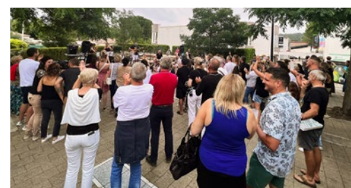
La municipalité tient à remercier l'ensemble des participants.