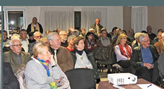
Pause-culture "Le catharisme des origines à nos jours" organisée avec le concours de la municipalité, le 6 février