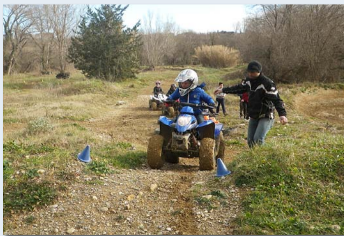
Sortie quad à Gignac