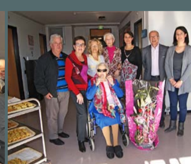
Anniversaire d'une résidente centenaire à Belle-Viste, le 9 février