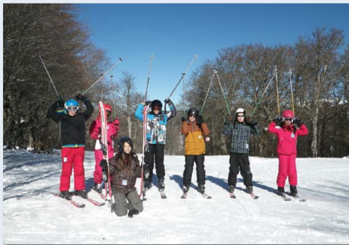
Sortie ski de piste à l'Aigoual

Ils ont par exemple pu faire du quad, du ski et de l'escalade, mais aussi jouer au lasergame et au bowling, ou encore s'initier au tambourin.