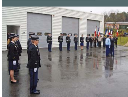
Revue d'effectifs à la brigade de gendarmerie de Saint-Gély-du-Fesc, le 19 janvier