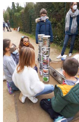
Études sur la biodiversité à l'école élémentaire Patus

Pour permettre de mener à bien ce projet, les services techniques de la mairie avaient fabriqué des composteurs, des bacs de jardinage et fourni du fumier et de la terre de qualité.