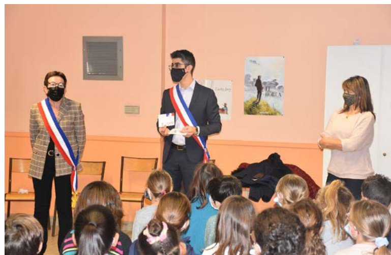
Ecole du Patus