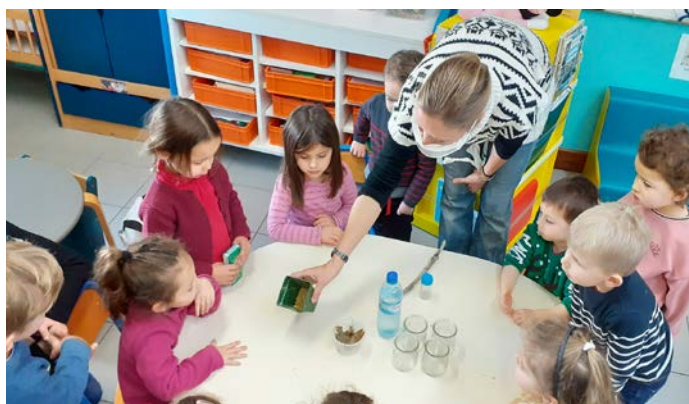
Atelier créatif à l'école maternelle Rompude

Dans les jardins, la préparation des sols est faite et une réflexion est menée sur les bonnes associations (plantations répulsives ou attractives). Si les plantes aromatiques, les bulbes et déjà quelques légumes (fèves, aulx, radis) ont été semés, l'essentiel des mises en terre se fera au printemps (fraises, salades...).