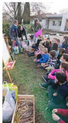
Fabrication d'un hôtel à insectes à l'école élémentaire Valène