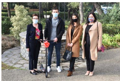
Madame le maire a remis une trottinette électrique à la gagnante du jeu tombola.

La ville travaille actuellement sur d'autres projets pour accompagner les entreprises du territoire.